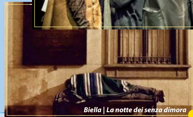
Biella | La notte dei senza dimora

13.30 Pranzo negli hotel 16.00 Tavoli di confronto per il discernimento e la testimonianza 20.00 Cena