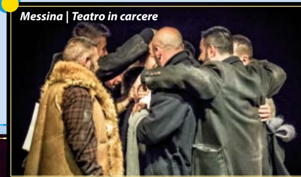
Messina | Teatro in carcere

12.30 Pranzo 15.00 Tavoli di confronto per il discernimento e la testimonianza 18.30 Celebrazione eucaristica 19.30 Cena