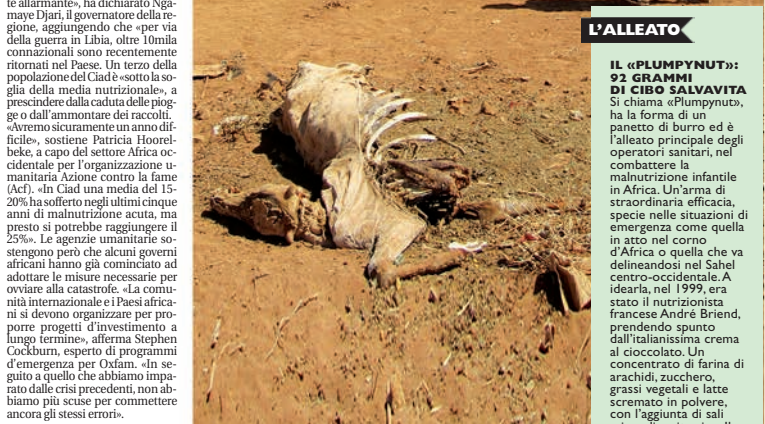
IL «PLUMPNUT»: 92 GRAMMI DI CIBO SALVAVITA. Si chiama «Plumptynut», ha la forma di un panetto di burro ed è l'alleato principale degli operatori sanitari, nel combattere la malnutrizione infantile in Africa. Un'arma di straordinaria efficacia, specie nelle situazioni di emergenza come quella in atto nel corno d'Africa o quella che va delineandosi nel Sahel centro-occidentale. A idearla, nel 1999, era stato il nutrizionista francese André Briand, prendendo spunto dall'italianissima crema al cioccolato. Un concentrato di farina di arachidi, zucchero, grassi vegetali e latte scremato in polvere, con l'aggiunta di sali minerali e vitamine. Il tutto in un panetto da 92 grammi che contiene circa 500 calorie e all'Onu costa 26 centesimi di euro. L'alto tasso calorico permette di recuperare peso in tempi molto rapidi (fino a 500 e più grammi a settimana), come è indispensabile nel trattamento terapeutico di un bambino gravemente sotto peso per malnutrizione acuta. Inoltre il Plumptynut non va diluito, eliminando così il rischio di malattie dovute all'acqua impura ed occupando meno spazio rispetto ad altri alimenti terapeutici dello stesso tipo. Nel Corno d'Africa è al momento l'alimento «salva vita». (G.M.)